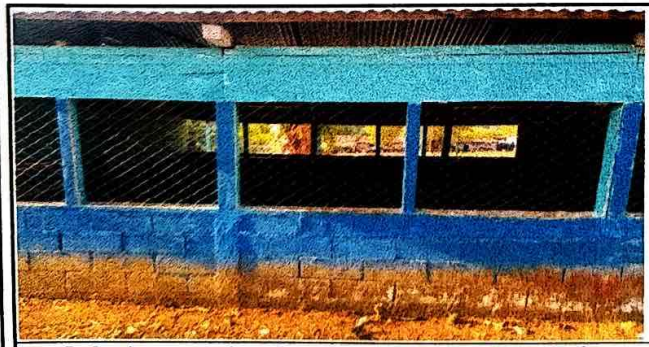
Foto 5: Se observa que la malla ya son reparadas y también las láminas. Se cambiarán por balcones y nuevas láminas.