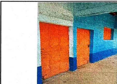
Foto 4: Se observa el color y necesita una reparación para que dará siendo el uso. Se cambiará el color y se hará una reparación y quedará como nueva