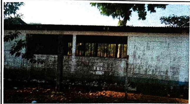
Foto 2: Se observa el deterioro de balcones porque ya no se encuebran en buen estado.