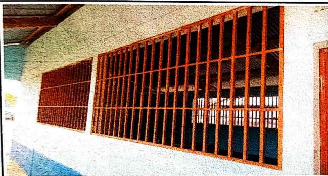
Foto 3: Se observa el oxidado de balcones y pintadas. Se necesita la reparación por eso se pintará para que quedará buena.