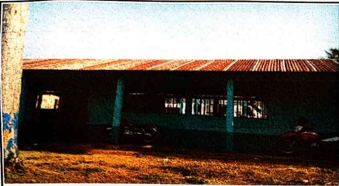
Foto1: Se observa el deterioro de láminas. Se cambiará porque ya están oxidado la cual provoca filtración de agua.